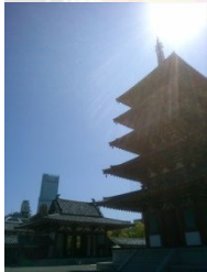
四天王寺からあべのハルカスを見る

今年の3月7日全面開業したばかりで、地上60階、高さ300mの日本一高い超高層ビルです。低層階は近鉄百貨店、その上にオフィスエリアがあり、19階にホテルロビー、38～55階が大阪マリオット都ホテル、58～60階が地上300mの展望台「ハルカス300」となっています。