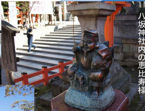
八坂神社内の恵比寿様

今年は49年ぶりに後祭が復活し巡行が2回に分かれた ため、全山鉾33基のうち23基の山鉾が巨体を軋ませな がら過ぎて行きました。大きいものと高さ25m以上、重 さは10t以上だそうで近くに来ると大迫力です。 以前に見た半田市の「はんだ山車まつり」とよく似た感じ ですが、さすがに京都だけあって雰囲気は良いですね。